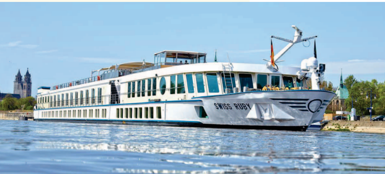
Das Superior-Flussschiff MS Swiss Ruby