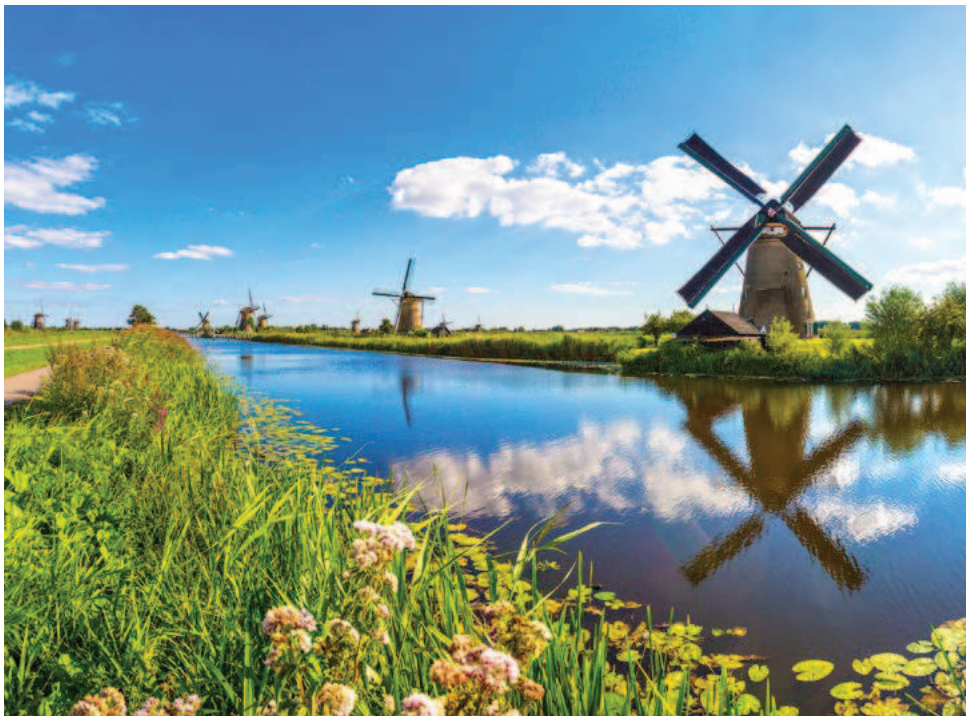
Impressionen in Holland