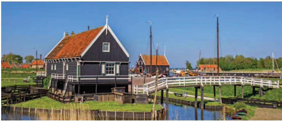
Idylle in Enkhuizen