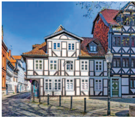
Fachwerk in Braunschweig