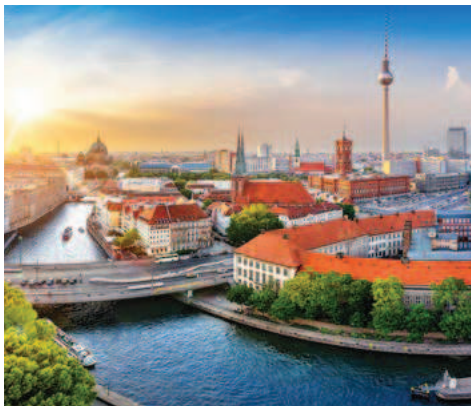
Blick über Berlin