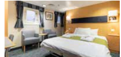
Suiten an Bord