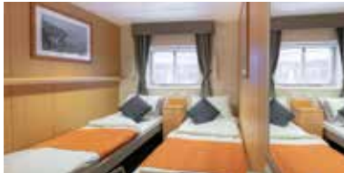
Komfort-Kabinen (teilweise Komfort Plus als Family-Kabine)